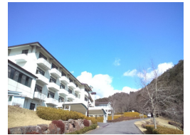
仲間と一緒に少年自然の家に泊まります

いつもご飯が出てくるのが当たり前、朝起こしてもらうのが当たり前。本当にそうかな？身の回りのことは全て子供自身で行うことで、ありがたさを実感できるように導きます。