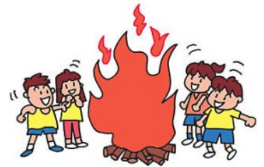
今年も伝説の入野コーチファイヤースがみれるかも？