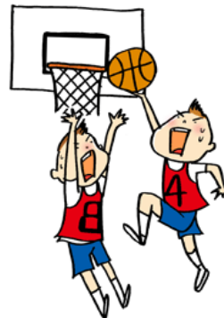
合計8時間以上のバスケ漬け合宿！

夕方、長良集合場所、鶉集合場所にて解散 後日参加者向けに解散予定時間を連絡します