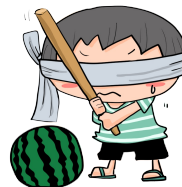
ミニッツ合宿名物！？スライダリ