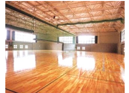
広々とした体育館を2日間貸切